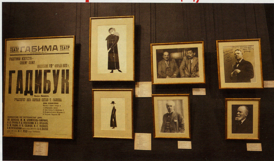
Фрагмент экспозиции, посвященный участию выдающихся деятелей русской культуры в судьбах еврейского театра